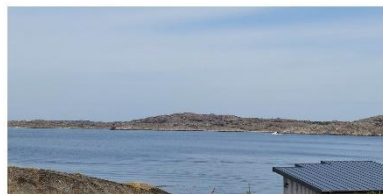
Vyer från utflykten till Klädesholmen och Mollösund